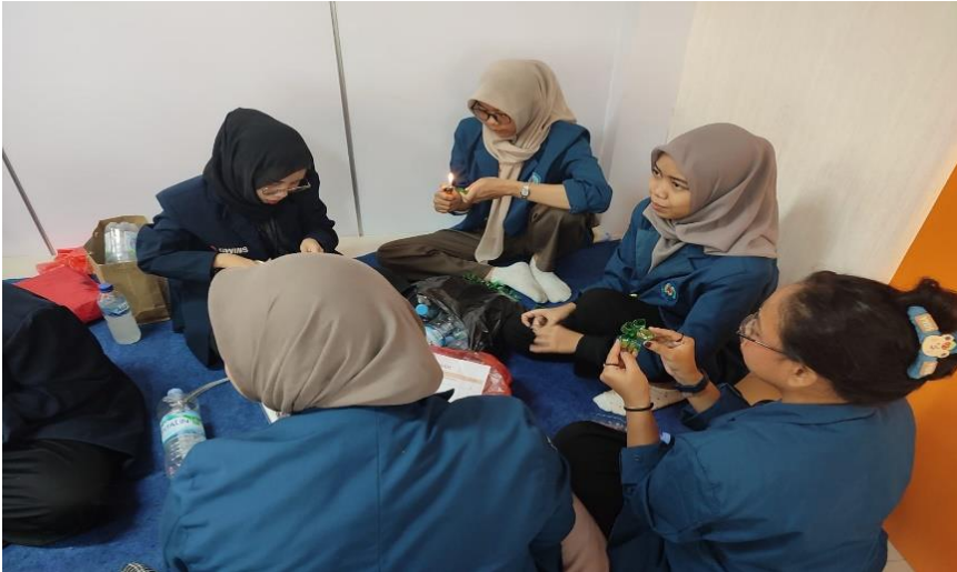
Gambar 2. Praktek Pembuatan Bunga dari Botol Plastik Bekas