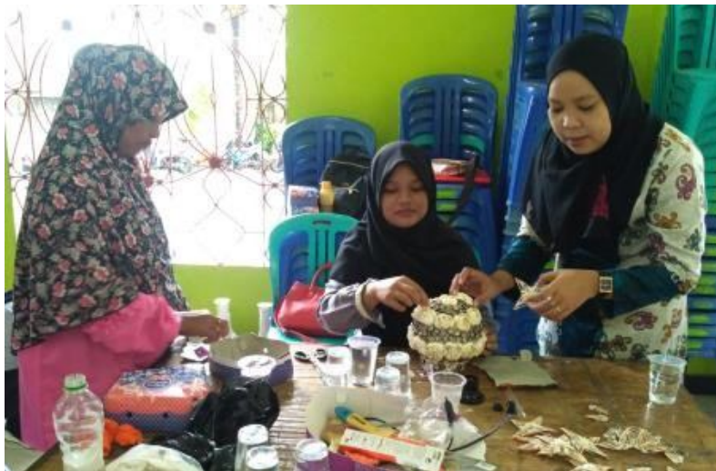
Gambar 4. Proses penempelan kerang lampion

Setelah dilakukan pemotongan ditempel pada media tempel model), untuk penempelan menggunakan lem epoksi / lem putih (lem kayu) di temple sesuai motif yang dikehendaki (Gambar 3).