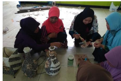
Gambar 3. Bahan Model Lampion (kiri), Proses pengeleman (kanan)

Setelah dilakukan pemotongan ditempel pada media tempel model), untuk penempelan menggunakan lem epoksi / lem putih (lem kayu) di temple sesuai motif yang dikehendaki (Gambar 3).