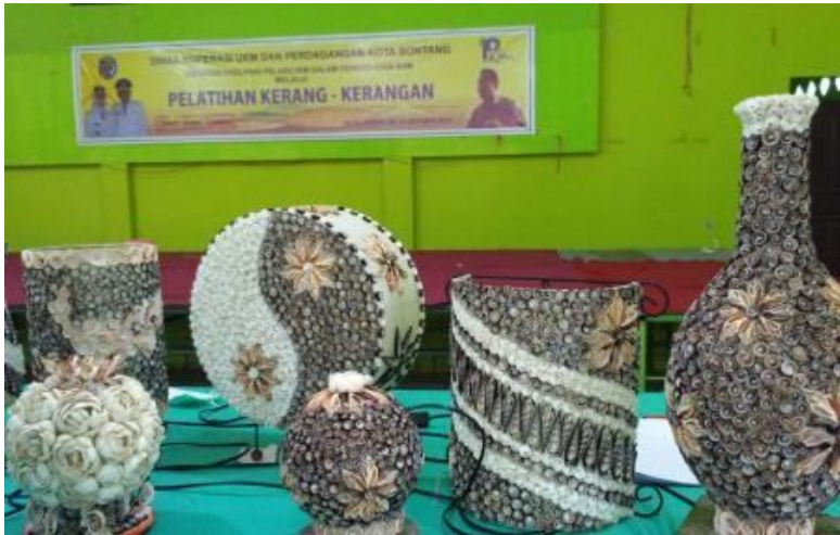
Gambar 5. Hasil Pembuatan Lampion