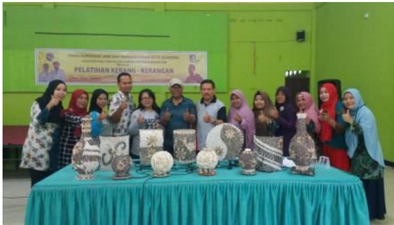
Gambar 6. Bersama pemateri pelatihan