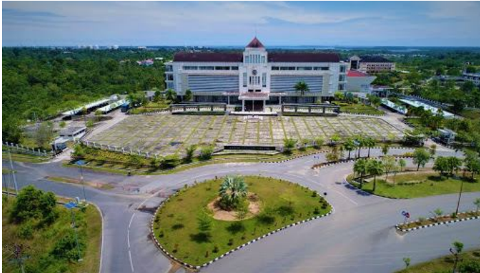
Gambar 1. Kota Bontang

pengelolaan kulit kerang jenis keong keong menjadi barang kerajinan.