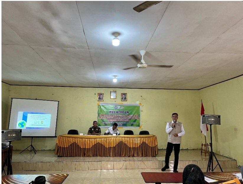
Gambar 4. Proses Diskusi dan Sharing Aparatur Desa dan Kader Kesehatan

Proses kegiatan tidak hanya bersifat satu arah, tetapi juga interaktif melalui diskusi dan sharing antara aparatur desa dan kader kesehatan. Peserta secara aktif memberikan masukan dan berbagi pengalaman sesuai kondisi riil di lapangan.