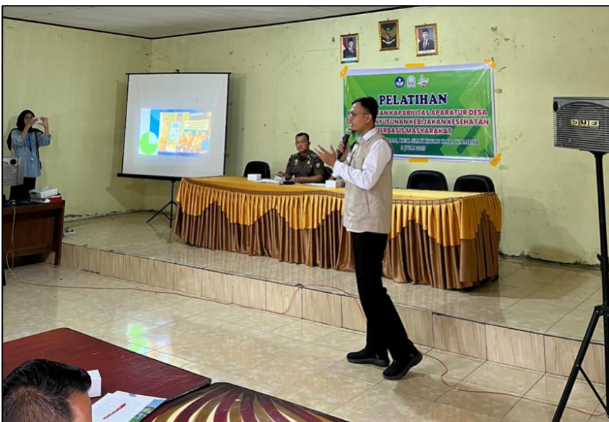
Gambar 3. Penyampaian Materi Kepada Aparatur Desa dan Kader Kesehatan.