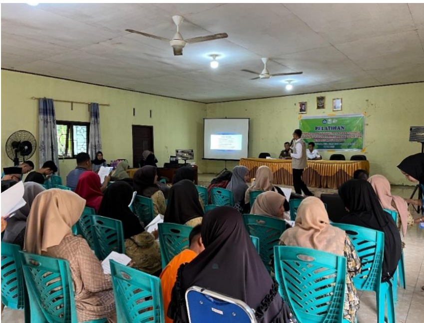
Gambar 2. Penyampaian Materi Kepada Aparatur Desa dan Kader Kesehatan.

Kegiatan pengabdian kepada masyarakat dilaksanakan secara langsung pada tanggal 2 Juli 2025 di Kantor Desa Lubuk Siam, Kecamatan Siak Hulu, Kabupaten Kampar. Kegiatan dimulai pada pukul 08.30 WIB dan diawali dengan sambutan dari Kepala Desa Lubuk Siam serta Ketua Tim Pengabdian dari perguruan tinggi. Peserta yang hadir terdiri dari aparatur desa, kader kesehatan, serta perwakilan masyarakat dan Badan Permusyawaratan Desa (BPD). Setelah sesi pembukaan, kegiatan dilanjutkan dengan penyampaian materi kepada aparatur desa dan kader kesehatan. Narasumber dari kalangan akademisi dan praktisi kesehatan masyarakat menyampaikan penyuluhan mengenai pentingnya penyusunan kebijakan kesehatan berbasis masyarakat.