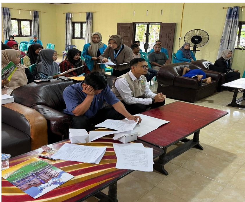
Gambar 5. Pendampingan Penyusunan Document Kebijakan

Selanjutnya, dilakukan pendampingan penyusunan dokumen kebijakan, di mana peserta difasilitasi untuk menyusun draft kebijakan melalui latihan, simulasi musyawarah desa, serta penggunaan modul, contoh format kebijakan, dan lembar kerja yang telah disediakan. Kegiatan ini mendorong peserta memahami secara praktis tahapan-tahapan penyusunan rencana kebijakan kesehatan berbasis masyarakat.