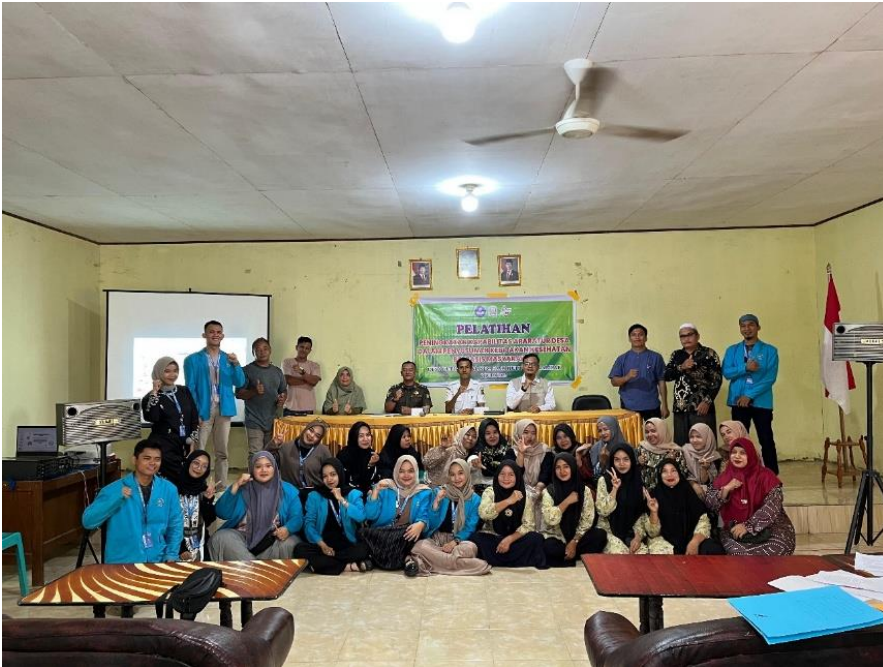
Gambar 6. Foto bersama Narasumber dan Aparatur Perangkat Desa

Sebagai penutup, dilakukan foto bersama narasumber, aparatur perangkat desa, serta seluruh peserta kegiatan. Dokumentasi ini menjadi simbol kebersamaan dan komitmen dalam mewujudkan penyusunan kebijakan kesehatan desa yang lebih partisipatif dan aplikatif. Secara keseluruhan, pelaksanaan kegiatan berlangsung aktif, partisipatif, dan mendapatkan respon positif dari seluruh peserta.