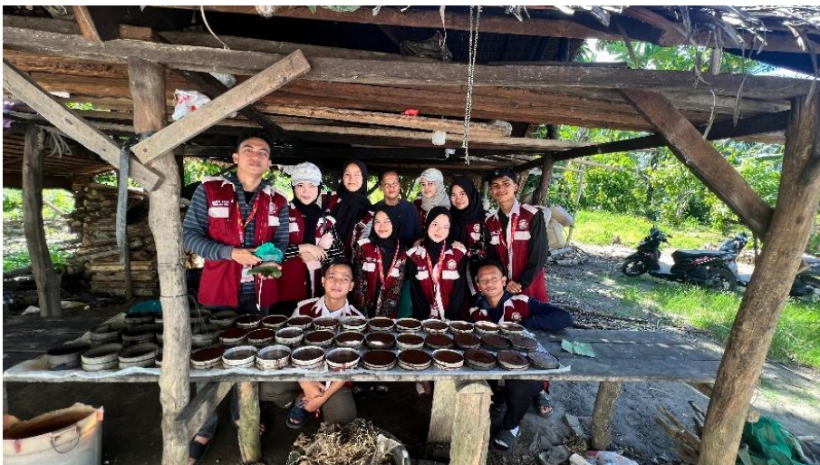
Gambar 3. Tahapan Penerapan Digitalisasi Google Maps UMKM di desa Dogang (UMKM Gula Aren)

Setelah kegiatan sosialisasi, pelaksanaan kegiatan dilanjutkan ke tahap penerapan digitalisasi UMKM melalui pembuatan dan optimalisasi Google Maps . Pada tahap ini, tim pengabdian melakukan pendampingan secara langsung kepada pelaku UMKM dalam proses pendaftaran usaha ke Google Maps melalui Google Business Profile . Pendampingan dilakukan secara bertahap dan disesuaikan dengan tingkat pemahaman masing-masing pelaku UMKM agar proses digitalisasi dapat berjalan dengan efektif dan tepat sasaran.