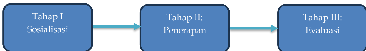
Gambar 1. Alur Pelaksanaan Kegiatan Pengabdian

Metode pelaksanaan kegiatan pengabdian ini menggunakan pendekatan partisipatif dan aplikatif, dengan menekankan keterlibatan aktif pelaku UMKM dalam setiap tahapan kegiatan (Agustina et al., 2025; Munawir & Erwina, 2025; Noor, 2025). Pendekatan ini dipilih untuk memastikan bahwa proses digitalisasi tidak hanya bersifat sementara, tetapi dapat diterapkan secara berkelanjutan oleh mitra UMKM. Kegiatan difokuskan pada integrasi Google Maps sebagai strategi peningkatan visibilitas dan akses pasar UMKM di Desa Dogang, Kabupaten Langkat.