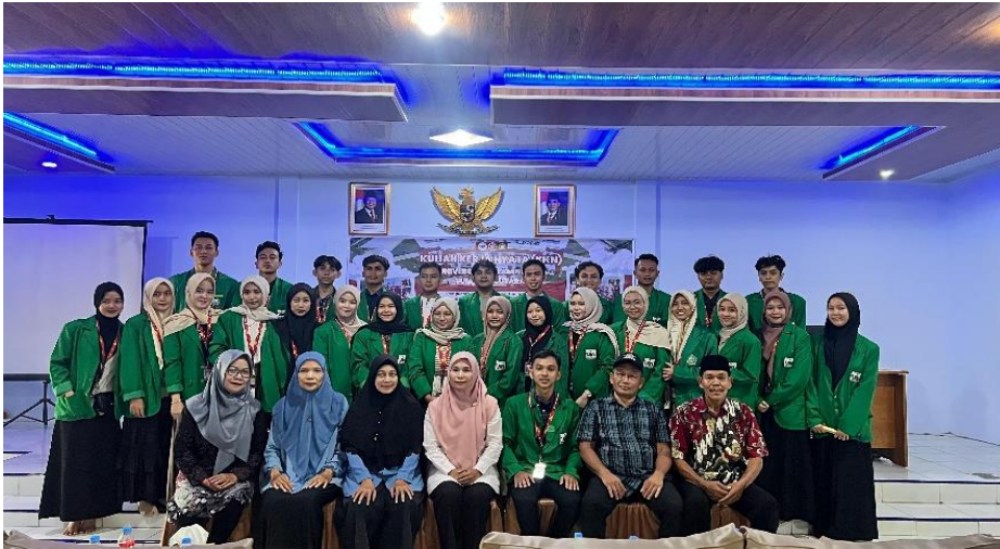
Gambar 2. Tahapan Sosialisasi Digitalisasi UMKM di Aula Kepala Desa Dogang

menyampaikan berbagai kendala yang dihadapi dalam menjalankan usaha, khususnya terkait keterbatasan pemanfaatan teknologi digital. Diskusi ini menjadi sarana untuk menggali kebutuhan dan kesiapan UMKM dalam mengikuti tahapan pendampingan selanjutnya, sekaligus menjadi dasar dalam pelaksanaan tahap penerapan dan pembuatan Google Maps secara lebih terarah dan sesuai dengan kondisi lapangan.