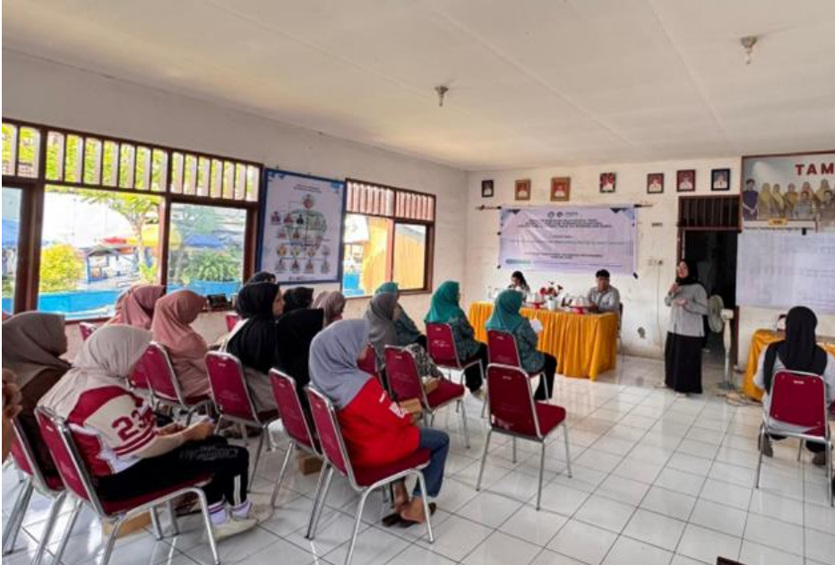
Gambar 2. Pelaksanaan Sosialisasi dan Diskusi Interaktif pada Partisipan

Partisipasi aktif peserta tidak hanya mencerminkan tingkat pemahaman yang meningkat, tetapi juga menunjukkan adanya kesadaran ( awareness ) yang lebih tinggi mengenai pentingnya pengelolaan keuangan keluarga secara terencana. Hal ini mengindikasikan bahwa kegiatan sosialisasi tidak hanya berdampak pada aspek kognitif, tetapi juga mampu mendorong perubahan sikap dan pola pikir peserta dalam mengelola keuangan rumah tangga secara lebih bijak dan sistematis.