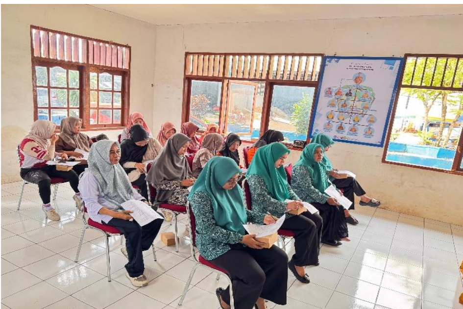
Gambar 3. Pelaksanaan Post-test pada Partisipan

Tahap selanjutnya adalah pelaksanaan post-test yang bertujuan untuk mengukur tingkat pemahaman peserta setelah mengikuti kegiatan sosialisasi dan diskusi interaktif. Prosedur pelaksanaan post-test tidak jauh berbeda dengan pre-test , yang diawali dengan pemberian instruksi mengenai tata cara pengisian kuesioner.