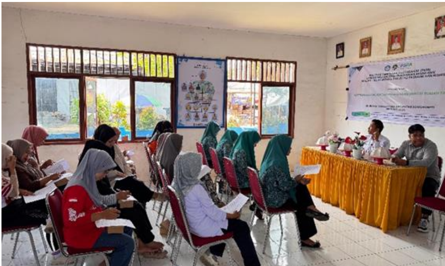
Gambar 1. Pelaksanaan Pre-test pada Partisipan

Pelaksanaan pre-test berlangsung selama kurang lebih 10 menit dan dikerjakan secara mandiri oleh seluruh peserta. Setelah proses pengisian selesai, kuesioner dikumpulkan dan dianalisis oleh tim pelaksana untuk memperoleh gambaran awal mengenai tingkat pengetahuan dan pemahaman peserta sebelum mengikuti kegiatan sosialisasi. Hasil pre-test ini selanjutnya digunakan sebagai dasar dalam menentukan fokus materi yang akan disampaikan, sekaligus sebagai pembanding dalam mengukur peningkatan pemahaman peserta pada tahap post-test .